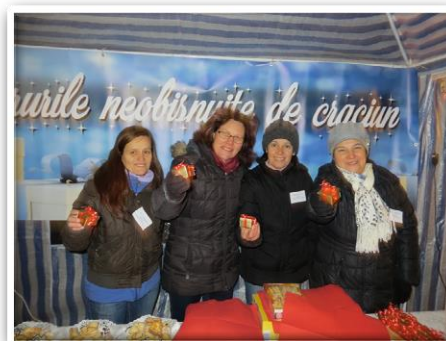
„Das besondere Geschenk“ Weihnachten in Calan